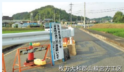
枚方大和郡山線宮方工区