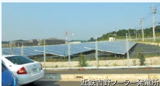
近鉄吉野ソーラー発電所