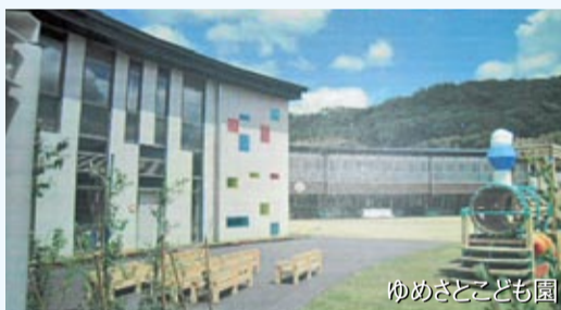
ゆめさとこども園