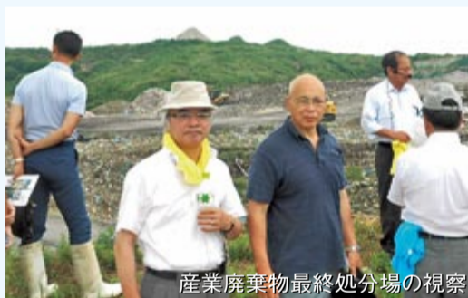
産業廃棄物最終処分場の視察